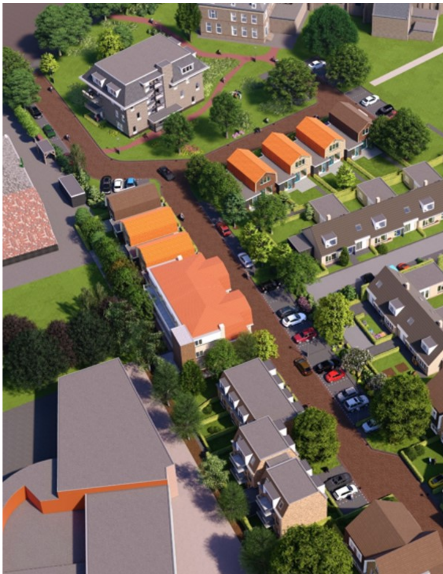
Een 'artist impression' van het plan, bron: Architectenbureau Peter van Duyn