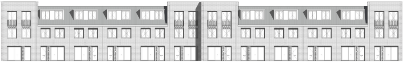
Het aanzicht vanaf de Driehuizerkerkweg. Stedenbouwkundig in stijl met Nieuw-Velserduin, architectonisch niet te vergelijken.