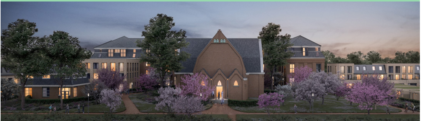
Het aanzicht vanaf de appartementen van Nieuw Velserduin. Rechts de boomgaard met de kangoeroewoningen. Door sloop van de sacristie ontstaat meer groene ruimte rondom de kapel.

Wij hebben ons best gedaan om, gewapend met de uitslag van de raadpleging, verbeteringen te bewerkstelligen, dat is ten dele gelukt. Toch hebben we als wijkcomité besloten om ons vanaf nu te richten op constructieve samenwerking met de projectontwikkelaar en de architect. De ervaring met Nieuw Velserduin heeft ons geleerd dat er nog heel veel geregeld moet worden voordat de bouw is afgerond.