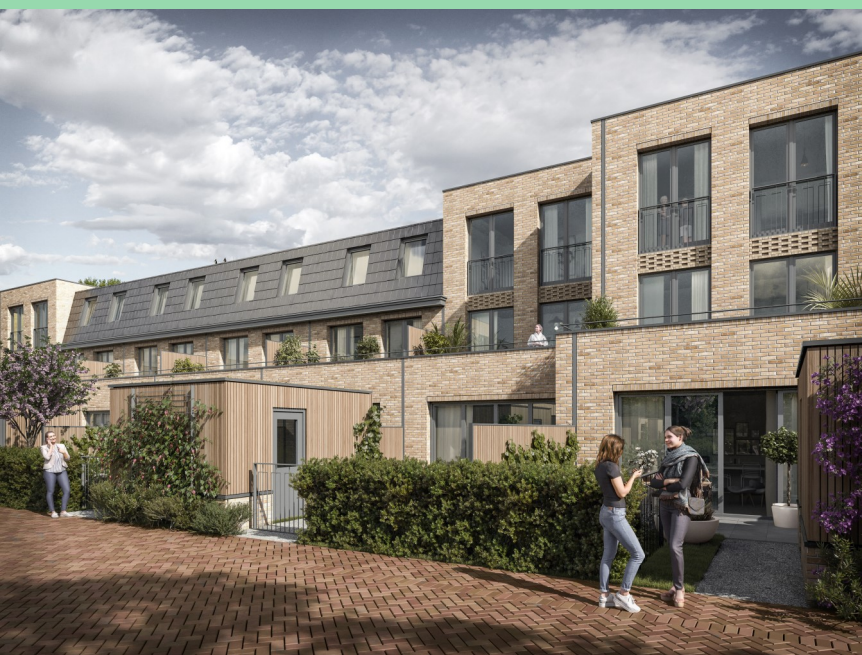
Het aanzicht van de woningen aan de Driehuizerkerkweg (op de huidige locatie van het parkeerterrein) vanaf de binnenruimte.